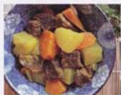
H16* 9,50€ Boeuf et légumes mijotés au curry