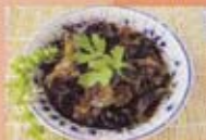
H8 4,50€ Salade de champignons