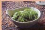
H7 4,50€ Salade d'algues