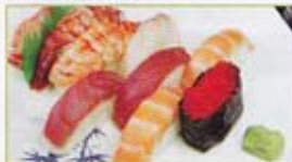
A3 15,00€ 8 sushi (2 saumon, 2 thon, 2 crevette, 1 maquereau, 1 œuf de capelan)