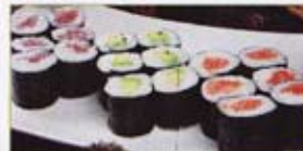
A2 11,50€ 6 maki saumon, 6 maki thon 6 maki surimi