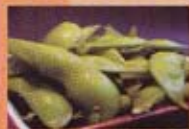
H9 4,00€ Edamane (fève de soja)