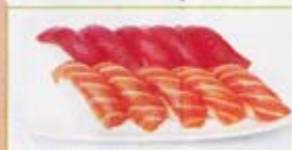
A1 13,50€ 4 sushi saumon, 4 sushi thon OU 8 saumon

Servis avec soupe miso et salade de chou