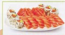
A6 17,50€ 6 california saumon 6 sashimi saumon 6 sushi saumon