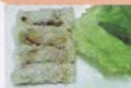
H12 6,50€ Rouleaux royaux (crevettes)