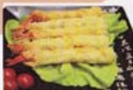
H13 10,00€ Beignets de crevettes