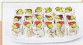
A7 15,00€ 6 california saumon 6 california thon 6 california crevettes