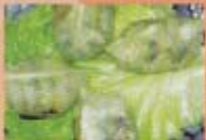
H11 5,00€ Ravioles grillés (crevettes)