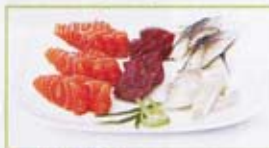
A5 16,50€ 20 tranches de sashimi (assortiment selon arrivage) 1 riz nature