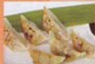
H11B 6,50€ Ravioles japonais (poulet)