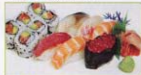
A4 15,00€ 6 california avocat saumon 6 sushi (2 saumon, 1 thon, 1 daurade, 1 œuf de saumon, 1 maquereau)