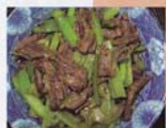
H17* 9,50€ Boeuf sauté aux légumes épicés

* Plats maison proposés selon quantité limitée