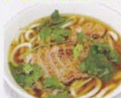
H2 9,00€ Soupe nouilles udon