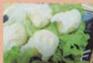
H11 5,00€ Ravioles vapeur (crevettes)