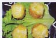
H14 5,50€ Bouchées vapeur (crevettes)