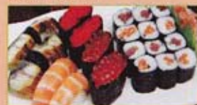
A8 26,50€ 6 maki saumon 6 maki courge marinée 8 sushi (2 œufs de saumon, 2 œufs de capelan, 2 anguille grillée, 2 crevettes)