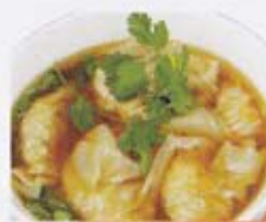
H2B 9,00€ Soupe de ravioles (crevettes)